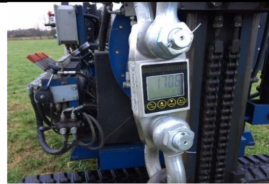
Test von Erdschrauben mit Zugkraft