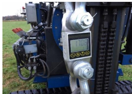
Test af jordskruer med træk vægt